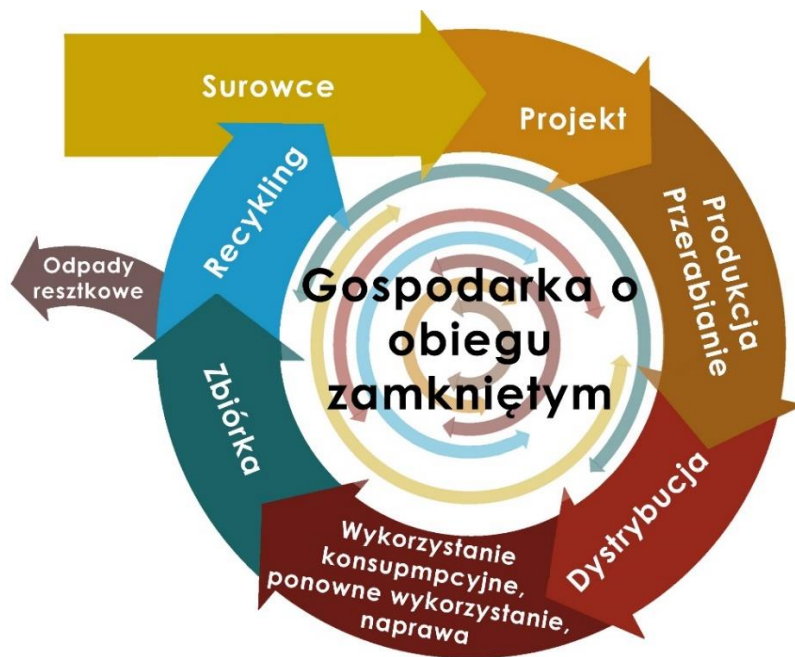
Rys. 2. Gospodarka o obiegu zamkniętym wg Komisji Europejskiej

Idea gospodarki o obiegu zamkniętym (cyrkulacyjna) stanowi alternatywę do gospodarki linearnej a jej podstawowe przesłania to: