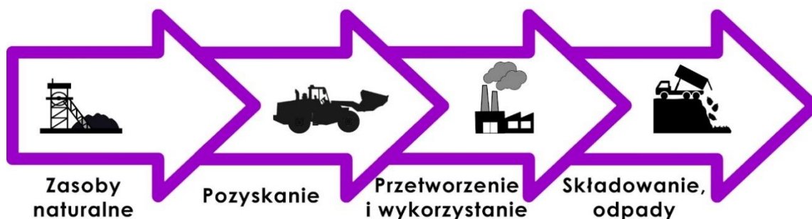
Rys. 1. Gospodarka linearna

Gospodarka o obiegu zamkniętym to globalny model gospodarczy, którego celem jest rozłączenie wzrostu gospodarczego od konsumpcji skończonych zasobów. Przedsiębiorstwa dostrzegają w tym znaczą korzyść nie tylko w podniesieniu wartości ich produktów, ale także zarządzaniu ryzykiem wynikającym z niestabilności cen oraz niepewności w łańcuchu dostaw. Zastosowanie wskaźników cyrkularności pozwala przedsiębiorstwom ocenić jak one są zaawansowane w zmianie swojego modelu biznesowego z linearnego na cyrkularny (rys. 1 i 2). Całość polega na inteligentnym zarządzaniu przepływami materiałowym zarówno w ramach cyklu biologicznego jak i technicznego. W cyklu technicznym materiałami zarządza się, ponownie użytkuje i na końcu poddaje recyklingowi. Natomiast w cyklu biologicznym materiały nietoksyczne wykorzystywane są kaskadowo i ewentualnie odprowadzane do gleby prowadząc do odtwarzania kapitału przyrodniczego.